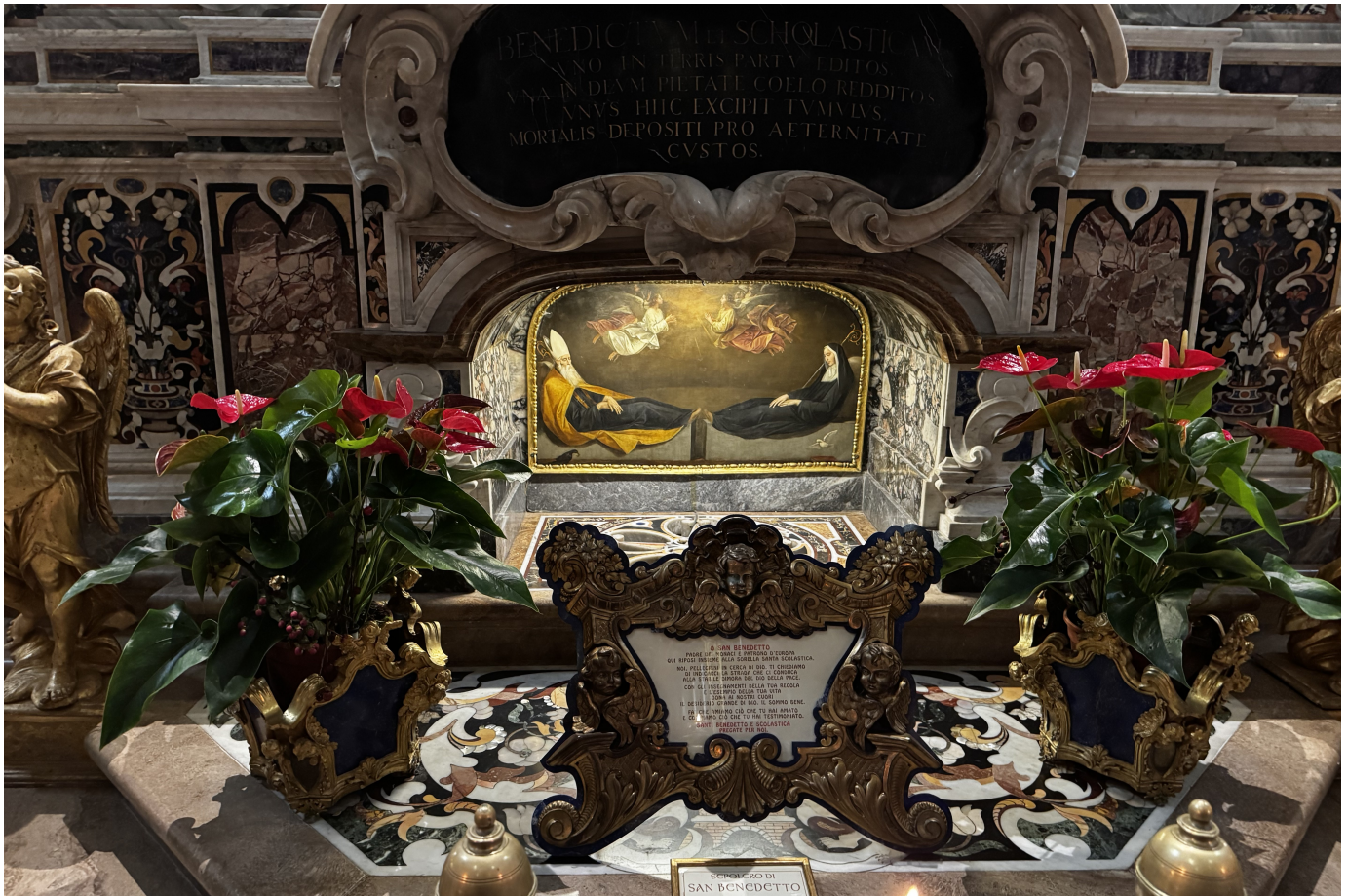
Tumba de san Benito y santa Escolástica en la abadía de Montecassino, en Cassino, Italia, junio de 2026.

El modelo benedictino de Ora et Labora ha influido en la vida de hombres y mujeres durante más de 1500 años. El equilibrio entre la oración y el trabajo es la tarea diaria de cada monje o monja benedictina. Diez rasgos fundamentales ayudan a dar forma a la vida benedictina, tanto para los monjes y monjas como para las instituciones que han fundado: